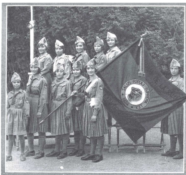
Foto 1: "Las Legionarias de la Salud.". Estampa , 15 de octubre de 1929, 1.

Key words: WOMEN'S EDUCATION; WOMEN'S STUDIES; WOMEN'S HISTORY; REGENERATIONISM; WOMEN'S ASSOCIATIONISM