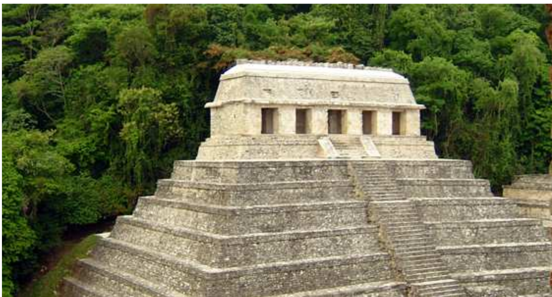
El templo de las Inscripciones de Palenque

El edificio, una pirámide de mampostería con un paramento de piedra que seguramente estaba revestido de estuco policromado, se alzaba a 36 m y culminaba en la crestería. El templo, con su galería en forma de pórtico, tiene una ornamentación de estuco que cubre los pilares de la fachada. Entre los vestigios de unos personajes de pie, que se distinguen todavía, se reconoce la efigie del heredero al trono, Chan Bahlum, dando los últimos toques a la tumba de su padre.