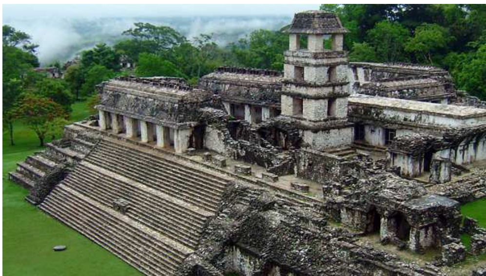
El Palacio de Palenque.

RESUMEN. Gracias a los documentos conservados de época precolombiana y de los primeros tiempos de la conquista y colonización española del Yucatán (códices y crónicas), así como los restos arqueológicos hallados en la ciudad de Palenque, se puede constatar que esta ciudad fue fundada por los mayas en torno al s.I d.C y despoblada, en gran parte, a mediados del s.X d.C., por razones que todavía hoy están en discusión entre arqueólogos e historiadores.