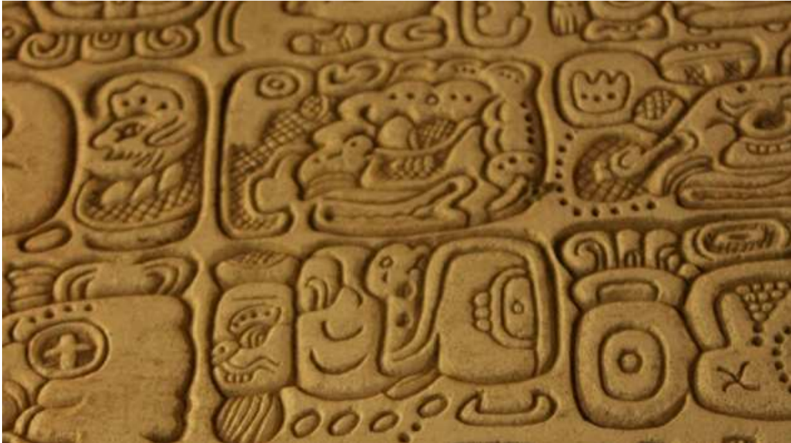
Jerográfico de la ciudad de Palenque

Los mayas manejaban el calendario de 260 días y el de 365 días, así como la Rueda Calendárica, o sea de las coincidencias de los dos calendarios, formando un siglo maya. Es la misma idea de los aztecas, que probablemente lo tomaron de la cultura maya. Los calendarios mayas y el cómputo de los años son tan exactos que no es fácil fijar las fechas exactas de cada suceso mediante una simple traducción de las fechas apuntadas en las estelas y códices dejados por ellos. Cada diez o veinte años, se erigían en las ciudades una monolítica estela conmemorativa, con inscripciones, que tenía una altura de entre 3 a 11 metros. Todo ello revela un gran interés por el tiempo cronológico e histórico, así como por la astronomía.