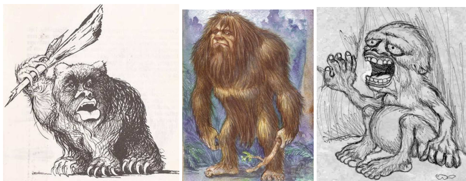
Diferentes representaciones del Ucumar